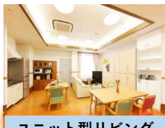
ユニット型リビング