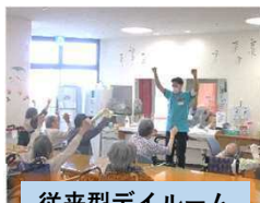
従来型ダイルーム

認知症専門棟／2階 (52床) 一般療養棟 /3階 (48床) ユニット棟 /2階 (10床)、3階 (10床)