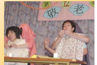
職員によるカキ氷の早食いや二人羽織りによるゲーム