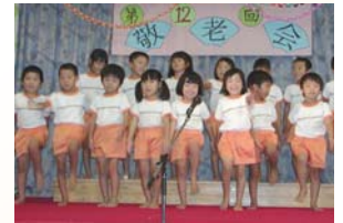
みずず保育園児による歌の披露!

今年の敬老の日は9月18日(第3月曜日)でした。敬老の日を迎えられた皆様おめでとうございます。この日は、「多年にわたり社会に尽くしてきた老人を敬愛し、長寿を祝う日」です。ハーモニー聖和でも今年は9月8日に通所サービス、翌9月9日に入所の敬老会を開催いたしました。ところで高齢者(老人)をどのような範囲で捉えるか、については意見が分かれるようです。統計上では「高齢人口」を65歳以上としています。65歳の皆さんを拝見していると、まだまだお元気な方が多いように感じます。高齢者の体力は非常に個人差が大きいといわれ、70歳でエベレスト登頂する人もいれば、50歳代で介護が必要な方もいらっしゃいます。日本の高齢者においては、障害者の皆さんも含めて他人の力を借りながら日常生活を営む皆さんに、余力のある皆さんが手を貸す仕組みづくりが求められています。人それぞれ体力・能力に違いは出てきますが、「出来ること」を「役割分担」しながら、一人ひとりが社会の一員として生きがいを感じられる社会になってほしいものですね。 ※ちなみに「敬老の日」は世界でも日本にしかない記念日だそうです。さすが世界一の長寿国ですね。