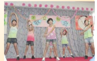
子ども達によるダンス!