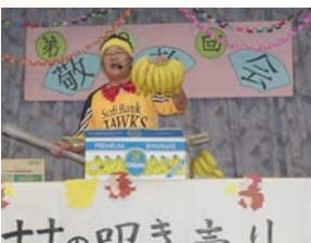
職員によるバナナの叩き売り